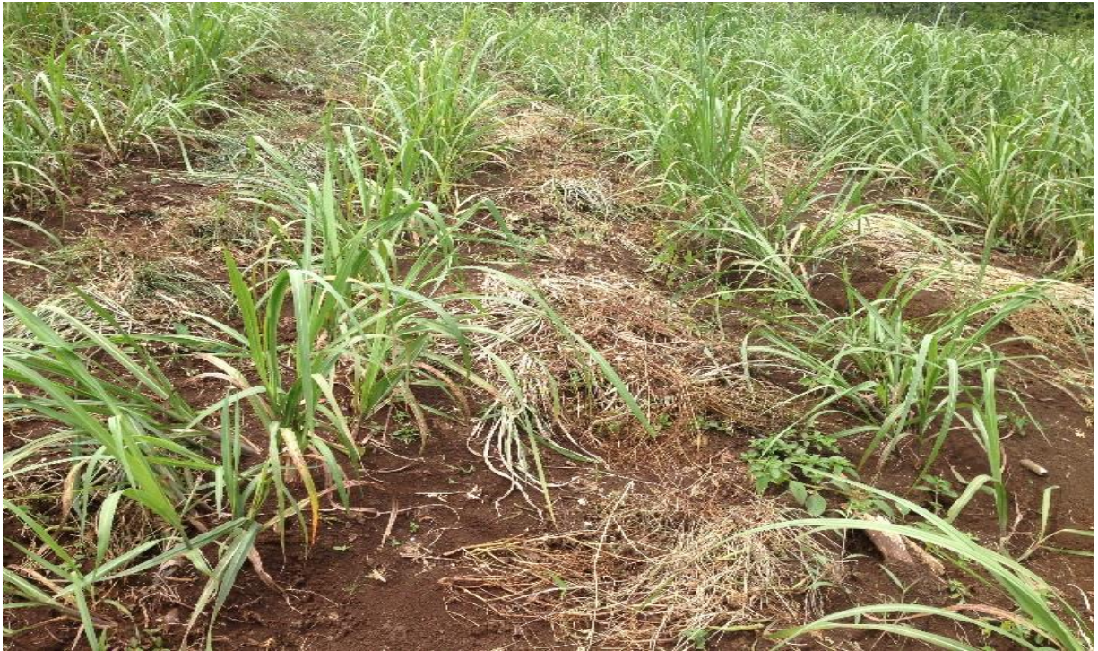
Figura 2. Parcela del agricultor a los 86 después de la siembra de la caña.