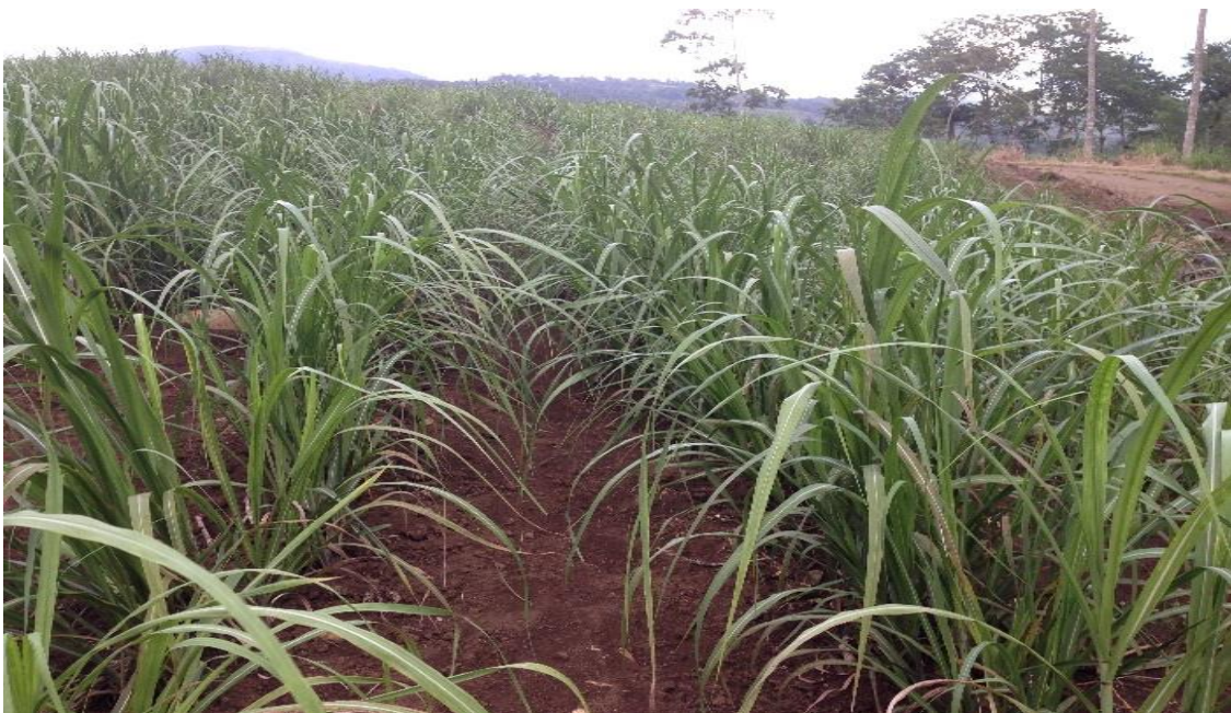
Figura 3. Parcela de LAICA a los 99 después de la siembra de la caña.