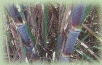
Fig. 2. Comportamiento Agroindustrial de la Variedad Q 96