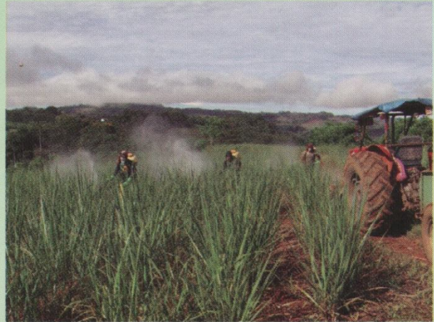
Aplicación de Fungicida