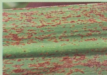
Fig. 1 Roya Naranja ( Puccinia kuehnii )

El origen de la crisis cañera regional se dio con la aparición de una nueva enfermedad llamada Roya naranja ( Puccinia kuehnii ) en Julio del 2007; cuando se hizo evidente el fuerte impacto de ésta en las plantaciones de caña de la Zona Sur. En ese año se determinó una incidencia del 37% del área foliar afectada; siendo la principal causa de la reducción de la producción de campo durante esa zafra (2007-2008) que pasó 59 t/ha a 45 t/ha para un descenso del 31% y con ello afectando severamente las variables de producción de caña (TM) y de azúcar fabricada; ya que se registraron pérdidas del orden de -79.754 TM y -177.234 Bultos de Azúcar (96º) de 50 Kg. correspondientes a -26,67 % y -25,08% comparado con la zafra anterior (2006-2007). Paralelo a la aparición en nuestro país se empiezan a tener reportes de la presencia de esta nueva enfermedad en otras áreas cañeras del continente americano (Estados Unidos, México, Guatemala)