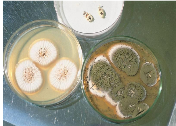
Hongos géneros Beauveria y Metarhizium

mismo se ve seriamente afectado por la emisión de otras sustancias (metabolitos secundarios como dextrinas, citocalasinas) que produce el hongo y que en el interior del insecto, provocan serias alteraciones fisiológicas. Estas sustancias en asocio con el crecimiento vegetativo del hongo, producen la muerte del insecto en el término de 4 a 8 días.