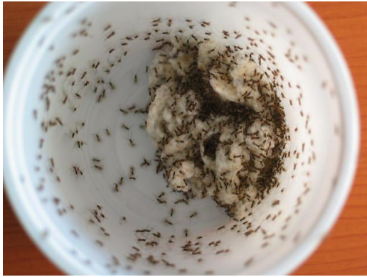
Cotesia flavipes listo para ser liberado