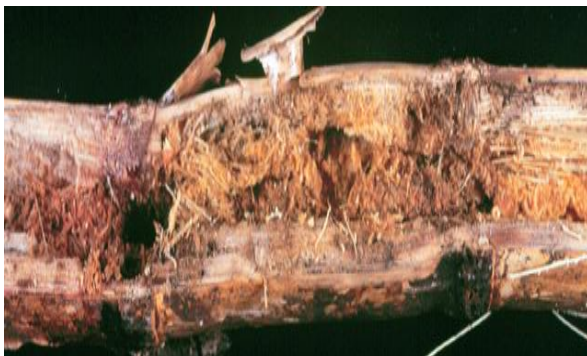
Daño provocado por M. hemipterus

A mediados de la década de los años 80's se reportaron severos ataques y daños productivos provocados por el insecto denominado "Salivazo", sobre todo en la región cañera de San Carlos. Debido a sus hábitos de vida, este singular insecto era de muy difícil control por medios químicos, que además resultaba oneroso e ineficiente. Esta situación motivó en DIECA a la búsqueda de una alternativa eficiente y segura de control. Fue así como en el año 1989, dio inicio aunque de manera incipiente el programa de producción del hongo Metarhizium anisopliae .