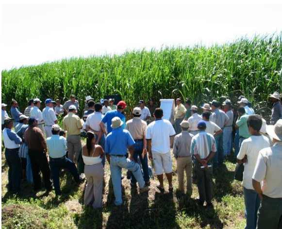
Capacitación técnica de productores

En consideración de que estos organismos no ejercen una función preventiva, por cuanto dependen de encontrar a su hospedero natural para cumplir su función, en este caso a la plaga; es también vital llevar a cabo un sistema eficiente y seguro de monitoreo poblacional, que aporte la información necesaria para decidir sobre la aplicación o no del mismo, tanto en cuanto al momento, como a la cantidad requerida. Esta acción representa para el Programa de Manejo de Plagas en general, un esfuerzo importante en cuanto a la capacitación al productor, sin la cual no se tendrían buenos resultados en el control.