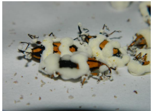
Picudo rayado ( M. hemipterus ) colonizado por Beauveria bassiana

Finalmente, el hongo sale al exterior, coloniza el cadáver del insecto y emite millones de propágulos infectivos (conidios) al medio que atacan otros insectos reduciendo la población y con ello la afección y el impacto productivo.