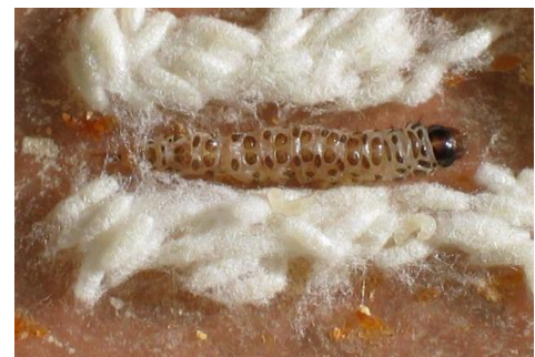
Proceso de parasitación y empupado de C. flavipes sobre D. saccharalis

Para la liberación en el campo, se debe conocer de previo mediante un riguroso sistema de monitoreo, la población de la plaga (número de larvas). El nivel de control o de liberación del parasitoide en el campo se ha establecido y fijado en 1.500 larvas promedio por hectárea; bajo ese nivel poblacional se liberan en teoría 4 parasitoides por cada larva del barrenador. Es sumamente importante también considerar las condiciones en que estos organismos son almacenados, transportados y liberados en el campo, ya que condiciones inapropiadas afectan directamente el potencial de control; por esta razón, debe de considerarse como parte integral del programa, la capacitación al usuario pero sobre todo al aplicador.