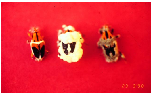
Parasitación de M. hemipterus por hongo.

El promedio nacional de parasitismo medido en salivazo en el periodo de 14 años (1990-2004) fue del 57,4%, siendo un nivel satisfactorio para programas de control biológico. Los mayores parasitismos se alcanzaron en el año 1996 con un 87,1% y 1999 con 77,0%. El parasitismo obtenido sobre otros insectos plaga del cultivo reportan grados superiores al 80% (cigarrita antillana, chinche de encaje). Es importante y necesario retomar de nuevo la medición de este indicador pues dejó de computarse como promedio nacional desde el 2004.