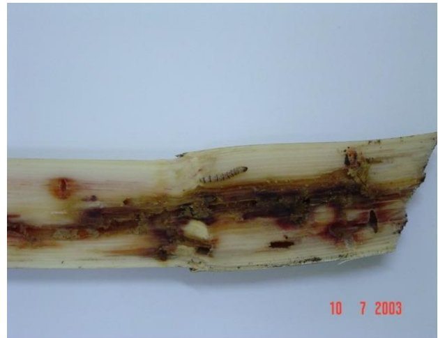
Daño provocado por Diatraea spp en los tallos

Debido a la naturaleza e intensidad del ataque y a la ubicación de la larva (dentro del tallo), que es la que produce el daño productivo, fue necesaria la puesta a prueba del sistema de control mediante el empleo del parasitoide (avispa) Cotesia flavipes , tecnología que fue original e inicialmente adoptada de Brasil en donde aportaba resultados muy satisfactorios. La misma fue posteriormente adaptada a nuestras condiciones y entornos productivos particulares. Para el año 1984, se realiza la primera liberación del parasitoide en el país.