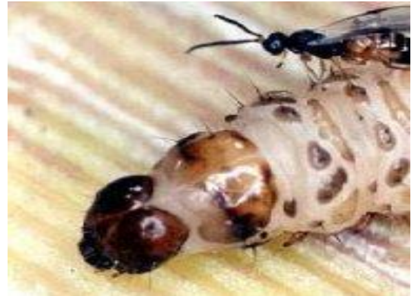
Avispa de C. flavipes en parasitación de Diatrea spp

La capacidad instalada actual de producción de parasitoides se estima es de 50 millones de avispas/año en condiciones favorables y con disposición plena del pie de cría requerido. El laboratorio logró alcanzar una producción máxima en el año 2009 al generar 46,9 millones de avispas, cantidad suficiente para atender 7.812 has cultivadas de caña, cubriendo con ello a cabalidad las necesidades nacionales y generando excedentes para la exportación. La mayor liberación nacional aconteció en el año 2007 con 33,8 millones que cubrió un área de 5.639 has.