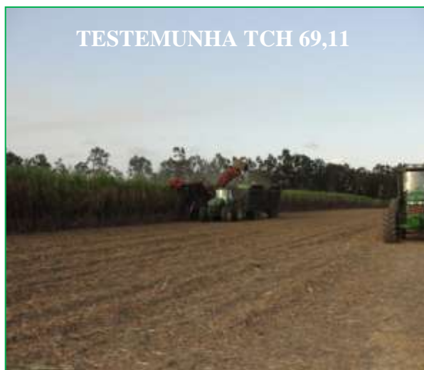
Foto 01 e 02. Resultado de um campo experimental na Fazenda Nossa Senhora do Carmo, Usina Estivas, em Arês – Rio Grande do Norte:

* COLHEITA - 04/10/2011 * PLANTIO - 03/09/2010 * VARIEDADE - RB 94 1541 * Fonte: Usina Santo Antônio