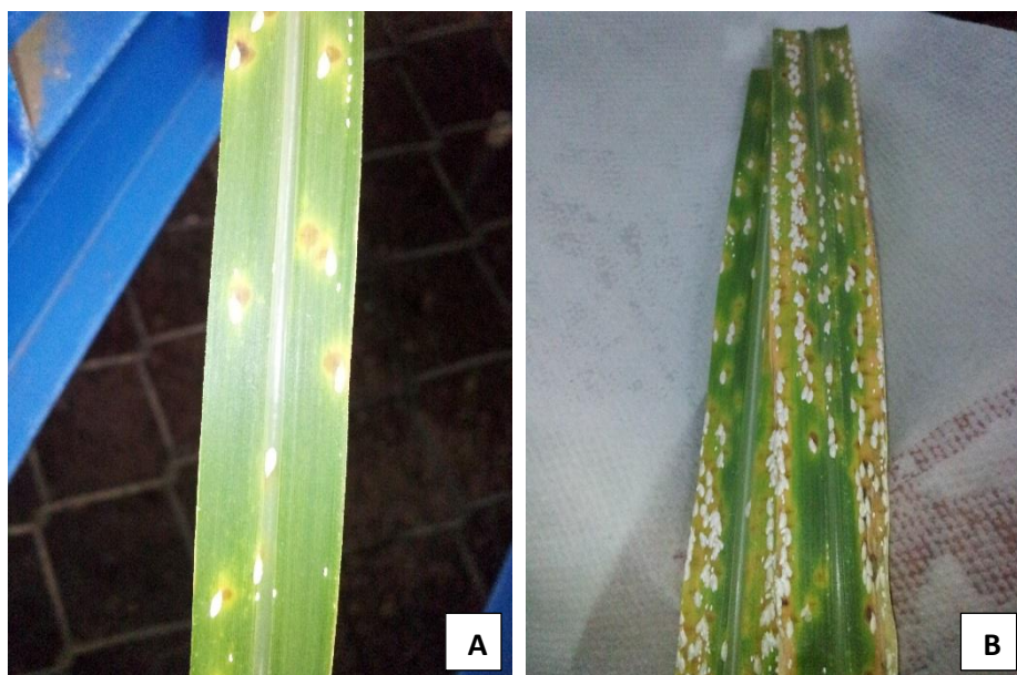
Figura 3. Manchas cloróticas generadas en el proceso de alimentación (A). Alta infestación de hojas provocando clorosis generalizada (B). Plantas en invernadero, Grecia. 2015.

Los estadios ninfales se localizan sobre el envés de las hojas; en infestaciones altas se ubican tanto en el haz como en el envés y se caracterizan por no producir secreciones azucaradas (CENICAÑA, 2013). Se encuentran de preferencia en hojas de la parte media a inferiores del follaje (Mendoza, et al., 2013). Esta escama está dispuesta de forma relativamente paralela a las nervaduras de la lámina de la hoja (Pantaleón y China, 2015).