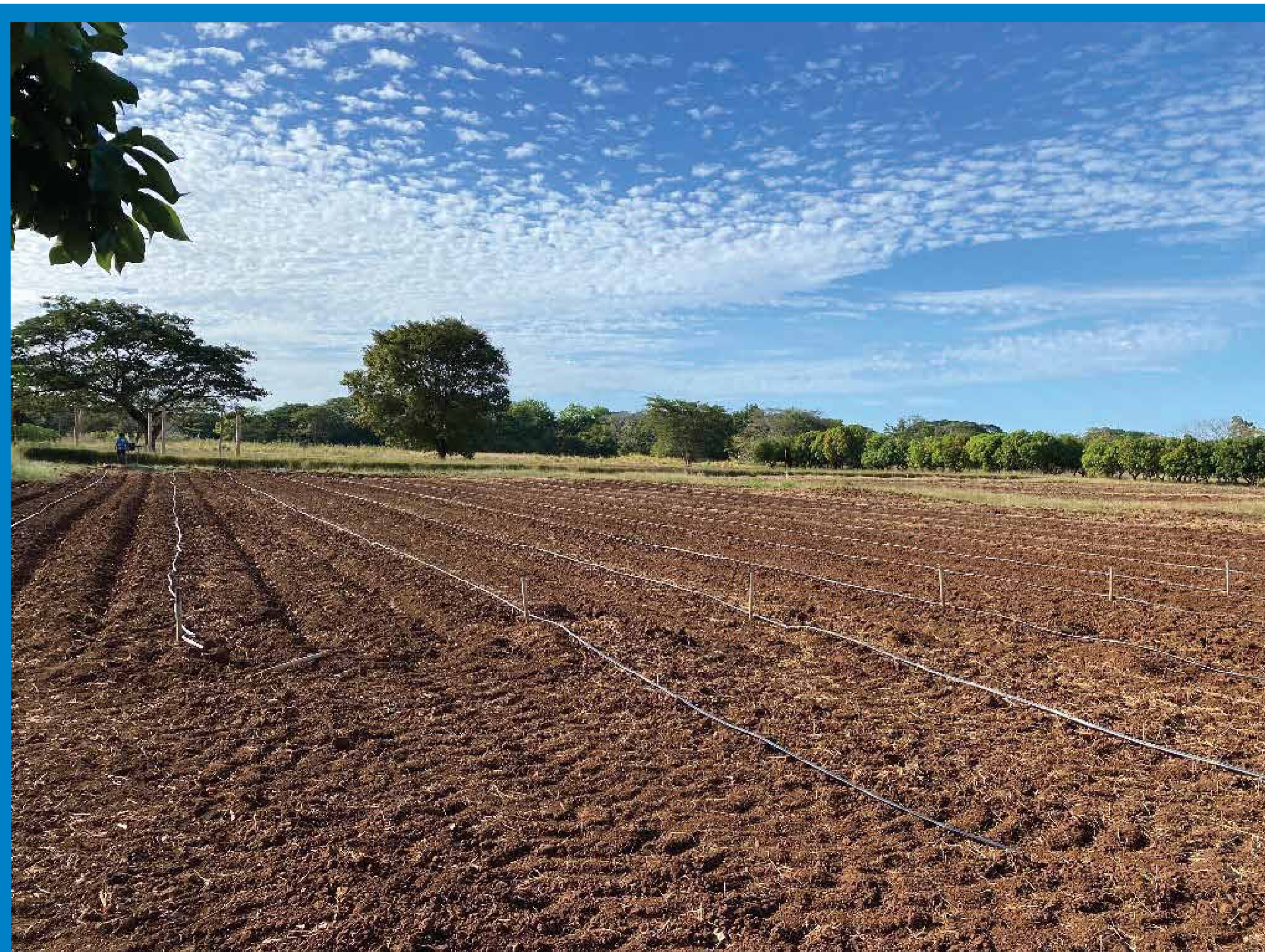
Área del proyecto de semillero. Finca Experimental Santa Cruz (UCR)

Este enfoque integral no solo contribuirá a mejorar los rendimientos del cultivo, sino que también fomentará prácticas agrícolas más sostenibles, beneficiando a las comunidades rurales y fortaleciendo la economía regional.