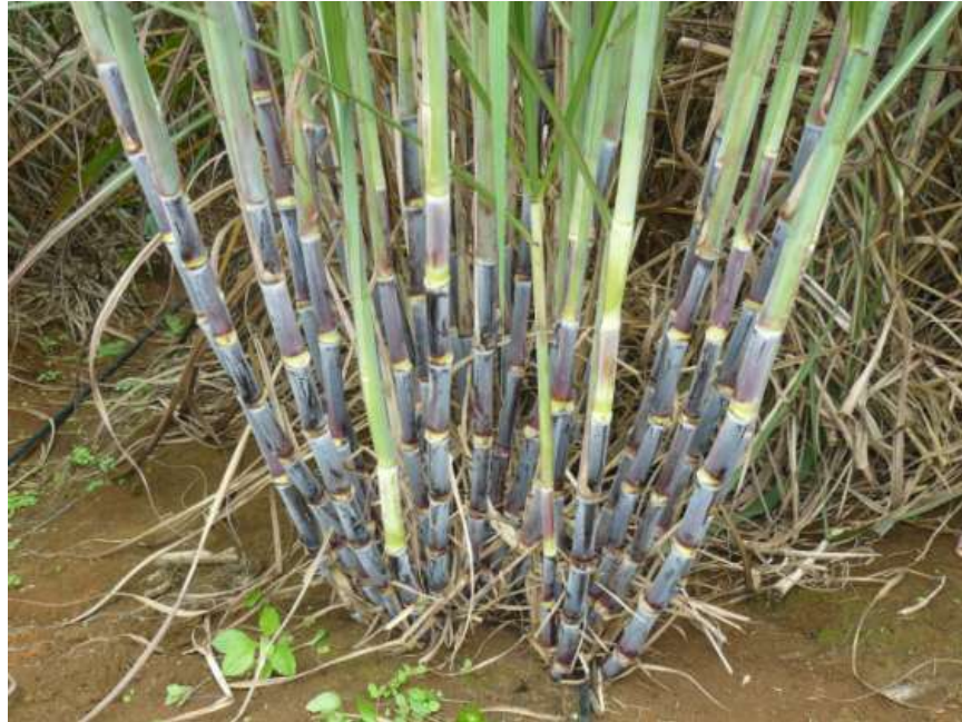
LAICA 01-604 (Progenitores Q 96 x SP 70-1143)