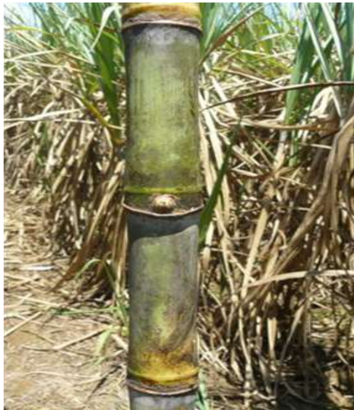
LAICA 03-805 (Progenitores Q 96 x SP 70-1143)