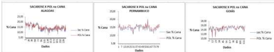
Figura 01 - Comparación de sacarosa y POL en Caña en los estados de AL, PE y GO

mayor que 1,0 (uno) (LEGENDRE y Clarke, 1996). En porcentaje la POL fue mayor en la planta en el estado de Pernambuco, igual a 4,20% , mientras que los valores de las plantas en los estados de Alagoas y Goiás eran igual a 2,67% y 1,40% , respectivamente. Esto puede explicarse porque el estado de Pernambuco presentar una topografía muy accidentada, lo que aumenta el tiempo entre el corte y procesamiento de la caña de azúcar, cosa que no ocurre con la planta en el estado de Goiás que no más existe la quema de la caña para el corte, siendo este todo mecanizado. En los gráficos de la figura 01 se observan comportamientos de POL y sacarosa en los estados estudiados.