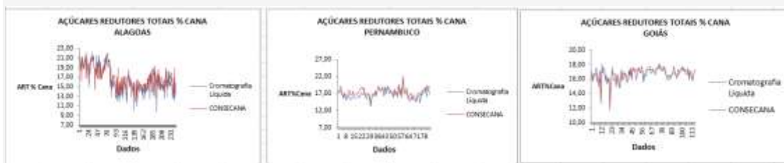
Figura 04 - Comparación de ART en las plantas en los estados de AL, PE y GO

Todas estas comparaciones muestran la inmensa necesidad para el uso de técnicas de análisis más precisos para evaluar la calidad de la caña de azúcar en Brasil.