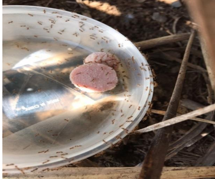
Trampas utilizadas para el monitoreo de hormiga loca ( Nylanderia fulva ). La Argentina, Grecia, Alajuela