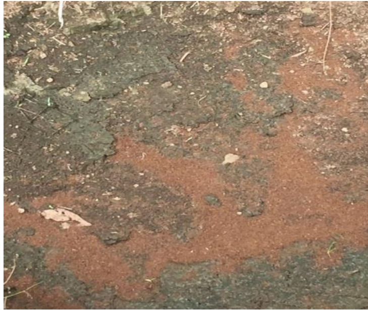
Población de hormiga loca ( Nylanderia fulva ) eliminadas después de la aplicación del cebo.