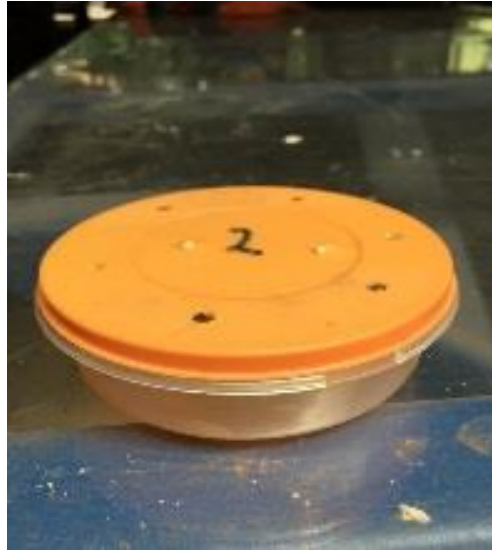
Trampa utilizada para captura de hormiga loca ( Nylanderia fulva ).