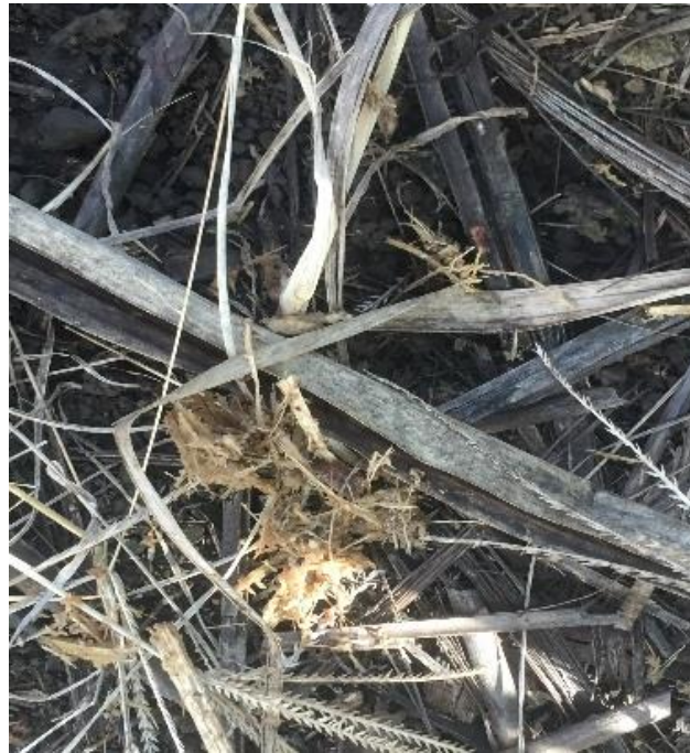
Cebo aplicado en plantaciones afectadas por hormiga loca ( Nylanderia fulva ).

La distribución del cebo se hace de forma uniforme al voleo intentando recorrer el campo por los entresurcos, que es en donde en su mayoría anidan las hormigas. Si se requiere aplicar en un cultivo de caña con una edad más avanzada, la distribución de cebo debe hacerse alrededor del campo, pero entrando al menos diez metros en los surcos para una mejor distribución. Es importante aplicar al voleo para la distribución más amplia de las partículas pequeñas. La aplicación del cebo reduce las poblaciones de hormiga loca y las mantiene bajas hasta por un periodo de tres meses. (Salazar et al, 2017).