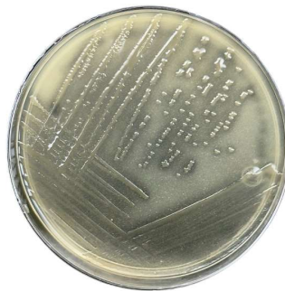
Figura 3. Cultivo de bacteria solubilizadora de fósforo: Serratia marcescens .