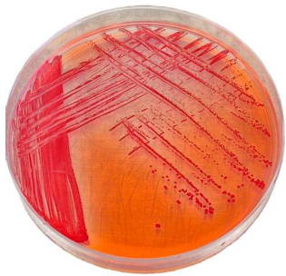
Figura 2. Cultivo de bacteria fijadora de nitrógeno: Azospirillum brasilense .

Actualmente, se encuentra trabajando en la gestión de recursos para establecer una biofábrica de biofertilizantes que permita producir inóculos de PGPB de alta calidad, con el objetivo de escalarlos a nivel de finca. Todas estas acciones contribuyen a fortalecer la resiliencia del cultivo y a fomentar una producción ambientalmente responsable en el sector cañero azucarero de Costa Rica.