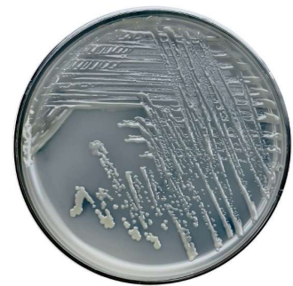
Figura 4. Cultivo de bacteria solubilizadora de potasio.