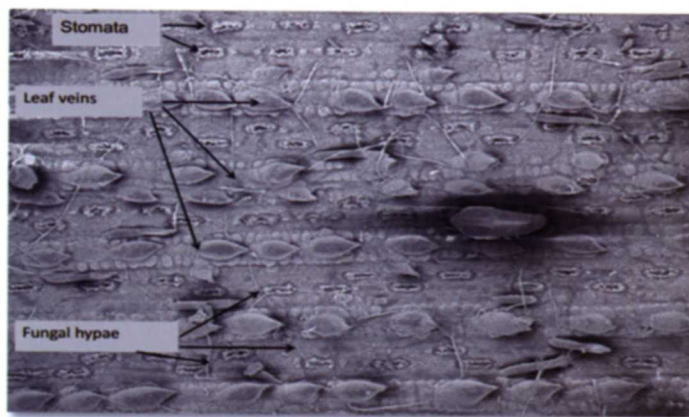
Figura 2. Abacarus sacchari alimentándose a nivel celular de la caña de azúcar (tomado de Nuessly, 2012).

Se localiza en ambas caras de la hoja, principalmente en la superficie del envés y a lo largo de ella, formando numerosas colonias; la población disminuye conforme se acerca a la parte distal de la misma. Se encuentran en todas las hojas de la planta, principalmente en las No. 2 y 3. La hoja 0 (bandera) y 1 presentan poblaciones bajas con respecto a la 2 y la 3, existe la posibilidad de que los ácaros de estas hojas migren a las nuevas infestándolas. Las más viejas manifiestan menores poblaciones, ya que éstas se vuelven senescentes, presentan áreas con tejido necrótico debido a la alimentación de los ácaros y además por el lavado de los mismos por la lluvia y la migración a zonas que brinden mejores condiciones para su óptimo desarrollo. Debido a que estos ácaros presentan estiletes muy cortos (aparato bucal), su alimentación es a nivel celular (Figura 2), vaciando su contenido, lo cual provoca síntomas característicos (Sanabria, 2008).