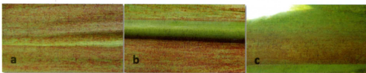
Figura 3. Síntomas del daño causado por el acaro A. sacchari en las hojas 2 y 3 de la caña de azúcar: a) Síntomas cubriendo toda la hoja, b) Síntomas solo en la lámina foliar y c) Síntomas solo en la nervadura central.

Los síntomas pueden aparecer en toda la hoja, sólo en la lámina foliar o en la nervadura central (figura 3, a, b y c), estos síntomas se pudieran confundir a los provocados por la enfermedad roya naranja Puccinia kuechni (Figura 4) (Nuessly, 2012).