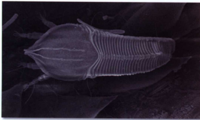
Figura 1. Forma del acaro anaranjado de la caña de azúcar Abacarus sacchari (tomado de Nuessly, 2012).

A. sacchari pertenece a la familia Eriophidae. Son ácaros ahusados en su extremo posterior, cilíndricos, con dos pares de patas, de tamaño muy pequeño (Figura 1). Es un ácaro de color amarillento mayor de 200 micras de largo.