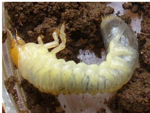
Fig. 1. Larva de tercer estadio (L3) de P. menetriesi .

frecuencia aparece en el Pacífico Central y Norte.