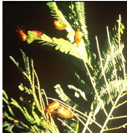
Fig. 3. Adultos de P. elenans alimentándose y copulando sobre un árbol de Malinche.

Las lluvias iniciales después de periodos secos provocan la salida del suelo de los adultos, tanto hembras como machos, al anochecer y durante varias horas nocturnas. Los abejones son atraídos por fuentes de luz o por sustancias segregadas por las hembras. Se dirigen hacia algunas especies de árboles, arbustos y hierbas específicos, sobre los cuales se alimenta y copulan; algunas de estas especies son: el Malinche ( Delonix regia ) (figura 3), el Guácimo ( Guazuma ulmifolia ), el Jocote ( Spondia purpurea ), el Poró ( Erythrina poeppigiana ) y la Yuca ( Manihot esculenta ), entre otros. Este comportamiento ha sido utilizado como excelente estrategia de control de la plaga. En ese momento, aprovechando la atracción a la que son sometidos, son conducidos y atrapados en trampas colocadas en las cercanías de estas plantas.