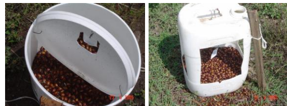
Fig. 5. Trampas de recipientes plásticos utilizados con feromonas.

Es importante señalar que esta trampa no requiere de fuentes de luz, por lo que es muy funcional; además, la feromona logra un rango de acción de varias decenas de metros a la redonda. Otra de las ventajas de esta trampa es que se mantiene efectiva a lo largo de un mes, lapso de tiempo que dura el “vuelo” de los abejones. Cuando son utilizadas para monitoreo se colocan a 200 m de distancia entre ellas. Para el trapeo o captura masiva se colocan a intervalos de 50 m. Colocadas de esta manera de recolectan más de 1500 adultos/trampa/noche.