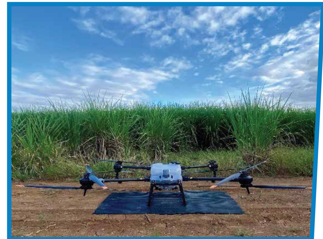
Inhibidores de floración