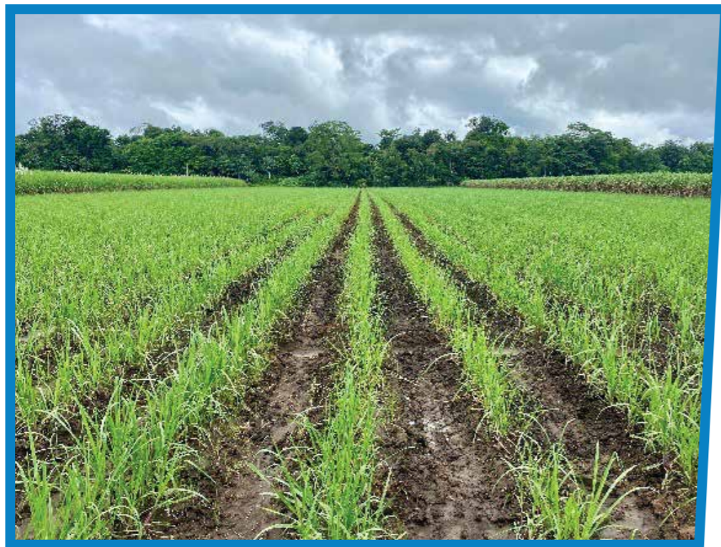
Aporca en caña de azúcar

La labor de aporca es la conformación del lomillo en el surco y la recomendación es realizarlo posterior a la última fertilización, tanto en siembras como en caña soca. Los objetivos de esta labor es dar un mayor anclaje a la cepa del cultivo y con ello evitar el volcamiento de la caña, promover el drenaje de los excesos de agua dentro del lote y así evitar los encharcamientos, además, permite mantener alineado las cañas en el surco, lo cual, es sumamente clave en la cosecha mecánica