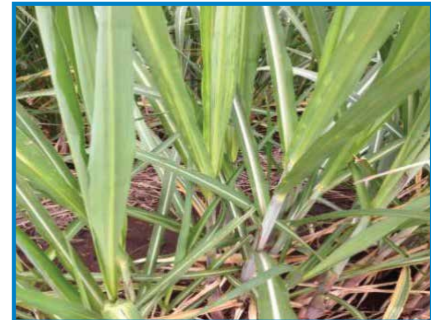
Virus del Mosaico (ScMV)