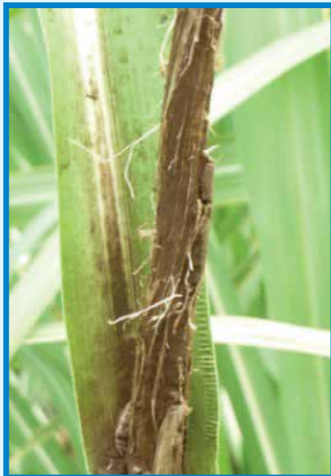
Carbón ( Sporisorium scitamineum )