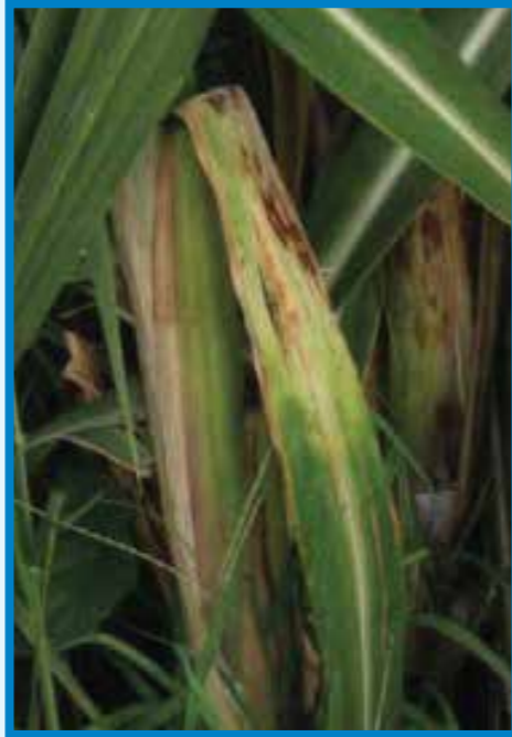
Pokkah boeng ( Fusarium moniliforme )