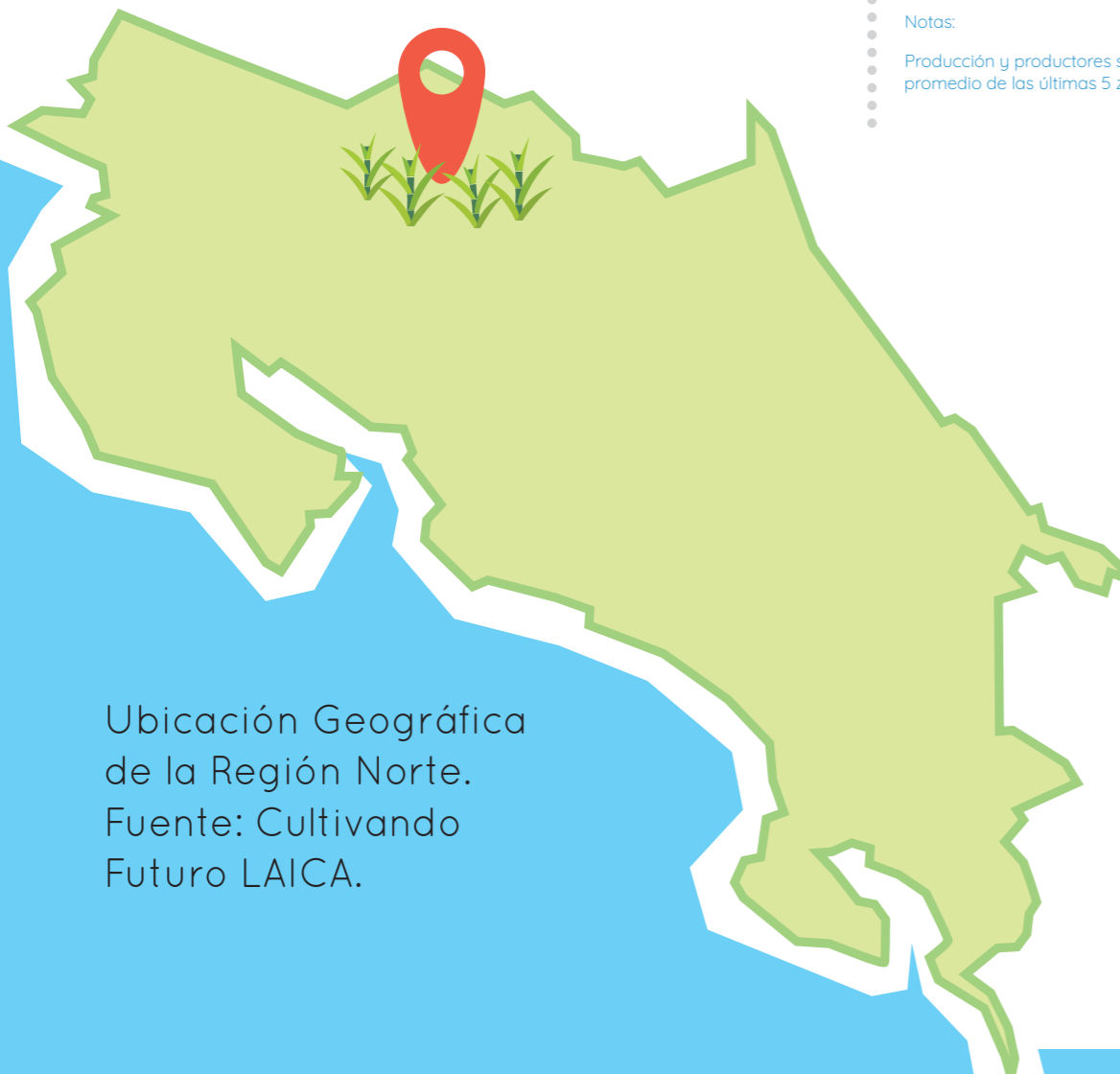
Ubicación Geográfica de la Región Norte. Fuente: Cultivando Futuro LAICA.

• Producción y productores son un promedio de las últimas 5 zafras.