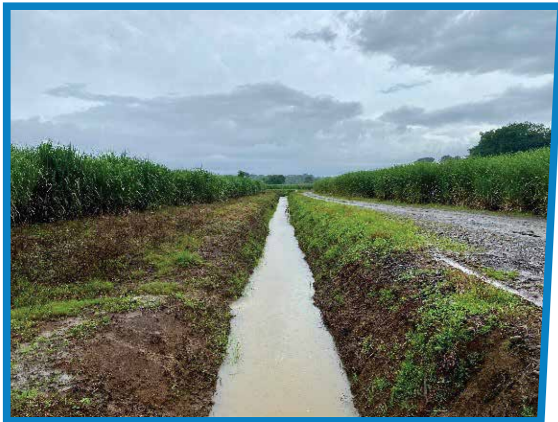
Drenaje en caña de azúcar

La precipitación promedio en la región Norte oscila entre 2 500 y 3 000 mm por año, por ende, es sumamente clave contar con un excelente sistema de drenaje que favorezca una evacuación eficiente y eficaz de los excesos de agua que las precipitaciones puedan generar en cada uno de los lotes. Es importante destacar que la inundación genera mayor afectación al cultivo, si se compara con respecto al déficit hídrico que genera una sequía prolongada. En el diseño y establecimiento de los sistemas de drenaje dentro de las fincas, es muy importante tomar en consideración las curvas de nivel con el objetivo de favorecer el drenaje natural.