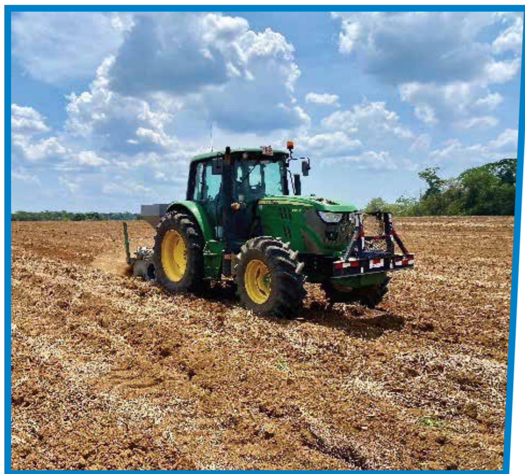
Labranza mínima (labor de canterizado)

En condiciones en las que exista una cepa vieja, o bien, se tengan residuos vegetales de algún otro cultivo o malezas y la intención es renovar la plantación, la recomendación inicial es efectuar la aplicación de un herbicida sistémico para tener un terreno limpio y listo para preparar. Posteriormente, se debe efectuar la labor de subsolado en dos ocasiones (en sentidos opuestos, es decir, en forma cruzada) y finalmente, la labor de surcado para la siembra.