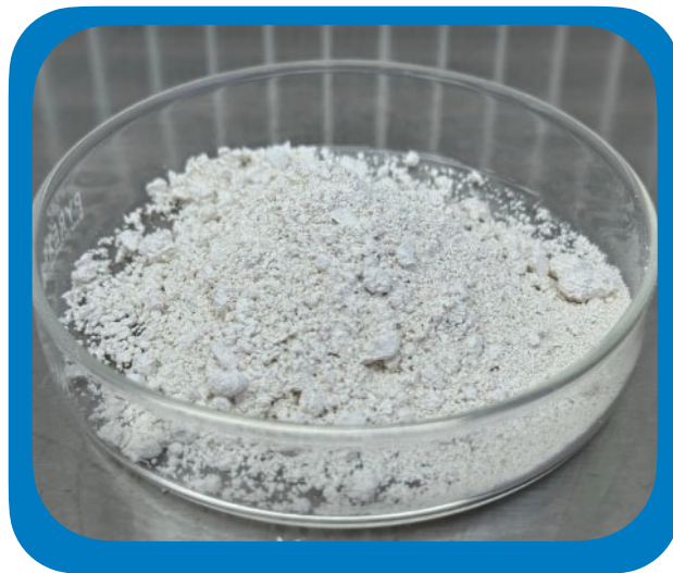
Figura 1. Formulación de Beauveria bassiana .

El Departamento de Investigación y Extensión de la Caña de Azúcar (DIECA) ha desarrollado un avance significativo en el control biológico de plagas en caña de azúcar. Tras un año de investigación, se logró formular un producto a base de Beauveria bassiana con mejoras sustanciales en estabilidad y eficiencia de aplicación.